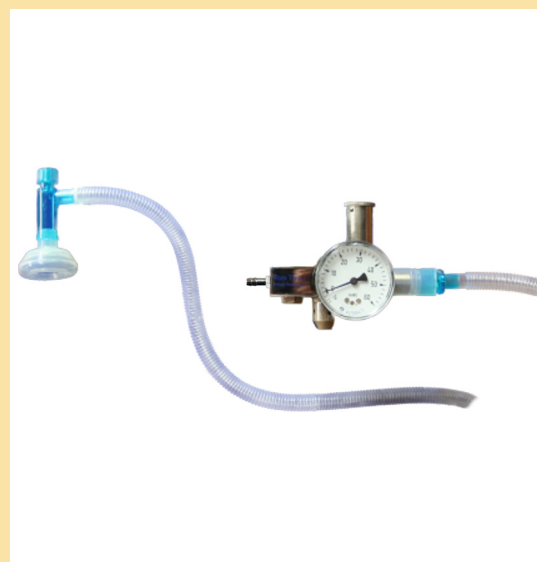
Configuración 1: TT480

También suministramos una amplia gama de equipos para su uso durante la fototerapia, el calentamiento infantil y monitorización de oxígeno.