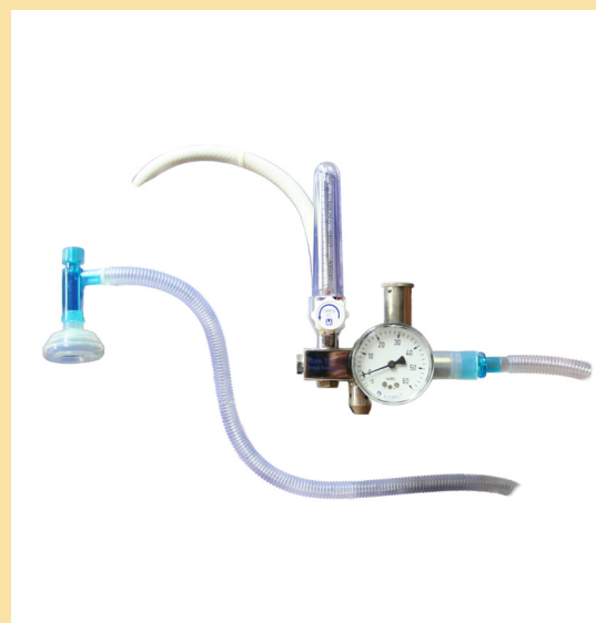
Configuración 2: TT490-15 con manguera Oxígeno 1m Configuración 3: TT490-15-3 con manguera Oxígeno 3m