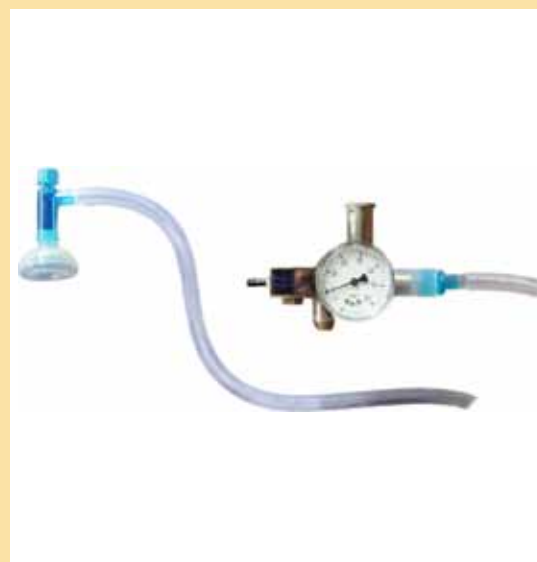
Configuración 1: TT480

También suministramos una amplia gama de equipos para su uso durante la fototerapia, el calentamiento infantil y monitorización de oxígeno.