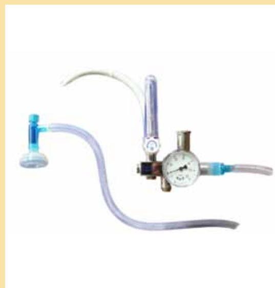
Configuración 2: TT490-15 con manguera Oxígeno 1m Configuración 3: TT490-15-3 con manguera Oxígeno 3m